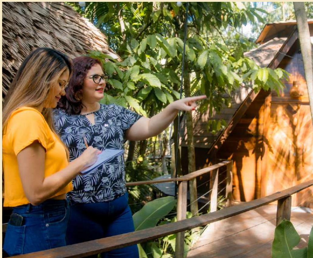
Visita técnica a cliente na Ilha do Combu - Acará/PA